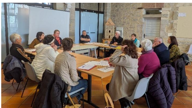
< AGE du 18/03/2025

L'EREF QVA utilise quotidiennement le logiciel métier Rural Emploi , qui contient plus de 1 400 dossiers de demandeurs d'emploi. La structure repreneuse s'est engagée à maintenir le logiciel et le même montant des cotisations pour l'année 2025 (50 € d'adhésion + 350 € de maintenance). Une hausse est toutefois envisagée en 2026, notamment en raison du changement de webmaster.