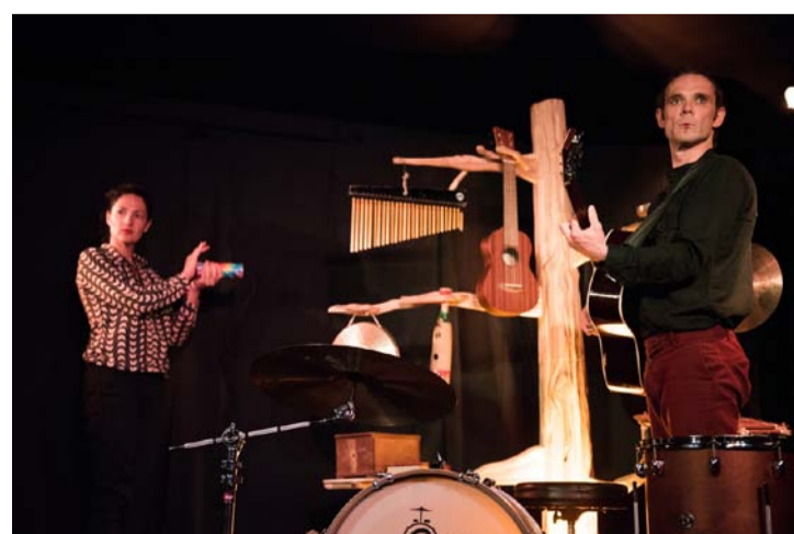
SPECTACLE BÊTES RENCONTRES, 14/10/23