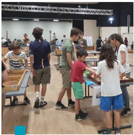
Ludothèque Tipi de Jeux - Soirée jeux