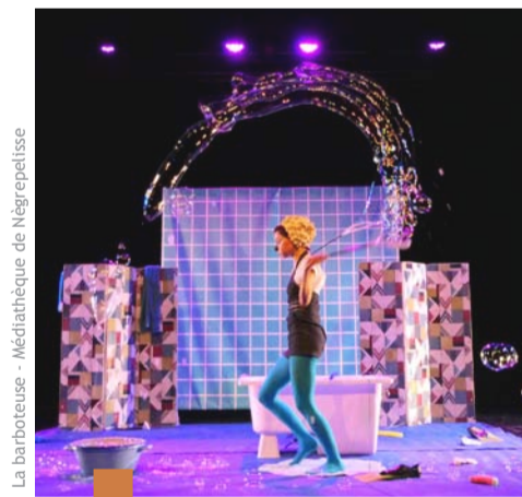
La barboteuse - Médiathèque de Nègrepelisse