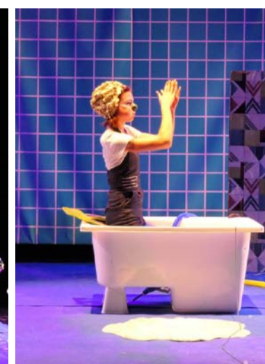
CIE L'ENVERS DU DÉCOR