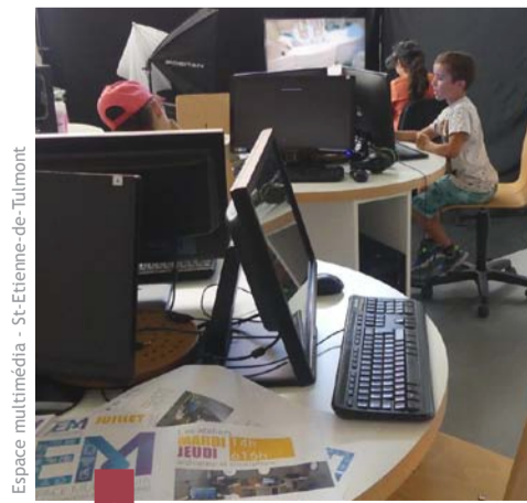
Espace multimédia - St-Etienne-de-Tulmont