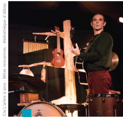
Cie L'arbre à sons - Bêtes rencontres - Médiathèque d'Albias