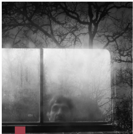
Expo photos Clara Javierre - Médiathèque Nègrepelisse