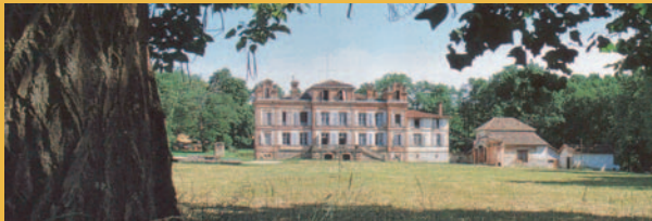
Le Château de Pousiniès, à l'entrée du Domaine de Pousiniès