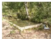
Le lavoir d'Embarre

Une balade facile à travers des paysages boisés et champêtres qui permet de découvrir le village médiéval de Montricoux et les prémices du causse. A noter quelques passages goudronnés.