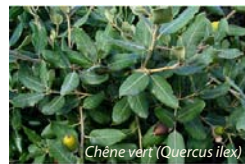
Chêne vert ( Quercus ilex )

Le chêne est un arbre de la famille des Fagacées (Châtaignier, Chêne, Hêtre), du latin Quercus , qui proviendrait du celte "kaerquez", "bel arbre". Il couvre 39% de la forêt française.