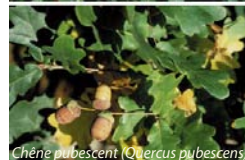
Chêne pubescent ( Quercus pubescens )