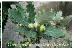
Chêne pédonculé ( Quercus robur )