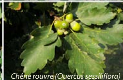
Chêne rouvre ( Quercus sessiliflora )

Sur les 400 espèces recensées, l'Europe en possède une dizaine, dont les plus communs sur notre territoire, les Chênes pédonculé ( Q. robur ), rouvre ( Q. sessiliflora ), pubescent ou truffier ( Q. pubescens ) et le chêne vert , à feuilles persistantes ( Q. ilex ).