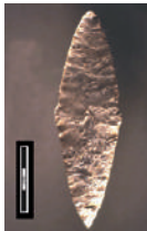
Dolmen 10 du Pech, poignard en silex

Vers 2 500 ans avant notre ère, les habitants des environs de Bruniquel ont bâti une dizaine de